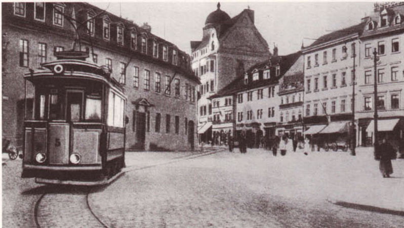
Straßenbahn vor dem Goethehaus.

»Ja, det is ja interessant. Is det der Tiergarten?« »Nein, einfach der Park, die Leute sagen auch Goethepark. Die Häuser stehen hier nur auf einer Straßensei-