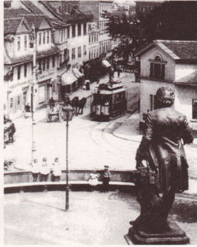
Als das Cafe Bückdich am Wielandplatz noch stand