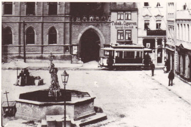
Straßenbahn am Markt.

»Vor lauter Quietschen hab ick diesmal nischt gehört. Wer is det Männecken mit der Bimmel?« »Das ist der Brezelmann vom Bäcker Geist, der geht durch die Kneipen und verkauft Brezeln. Halt dich fest, es kommt wieder eine Kurve.« »Warum quietscht eure Straßenbahn nur so gräßlich?« »Sag bloß, eure Straßenbahn quietscht nicht?« »Die Berliner Straßenbahn quietscht nicht. Vielleicht die 72 a am Kupfergraben.« »Mein Gott, 72 a.« »Wie viele Linien habt ihr denn?«