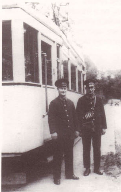
Straßenbahnbesetzung an der Endhaltestelle »Falkenburg«.

te. Deshalb stellen die Droschkenkutscher ihren Fahrgästen die Rätselfrage, warum die Leute hier den Eierkuchen immer nur auf der einen Seite braten. Antwort: weil nur auf der einen Seite