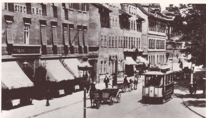
Straßenbahn der Roten Linie am Karlsplatz.

hieß er noch Schweinsmarkt und roch auch so. Zumindest in der Straßenbahn riecht es besser, verbietet die Vorschrift doch die Mitführung von geladenen Gewehren und Gepäck, das einen üblen Geruch verbreitet. Da vorn stehen die Pferdekutschen vor dem Russischen Hof.«