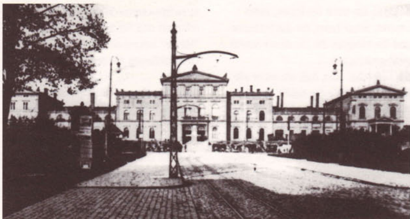
Haltestelle Bahnhof am alten Bahnhofsgebäude.

» H erzlich willkommen in Weimar, Tante Agathe! Und herzlich willkommen in unserer Straßenbahn! Damit du nicht denkst, nur Spree-Athen hätte dieses neuzeitliche Verkehrsmittel - IIm-Athen hat es auch, und zwar schon seit 1899.« »Was du nicht sagst! Nun hilf mir aber gefälligst, ich habe nämlich nicht nur einen Koffer, ich habe auch meinen Plaid und meine Hutschachteln.« »So, steig ein in die Rote Linie, wenn du zur Falkenburg willst.«