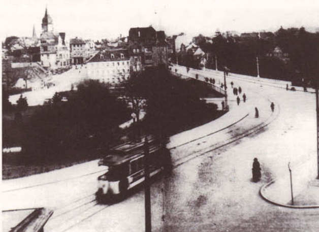
Straßenbahn am Viadukt, im Hintergrund Turm der Jakobskirche.

»Ja, det is interessant. Was is das für ein schönes Haus?« »Das ist das Bertuchhaus, und das die Bürgerschule, die wurde 1825 gebaut, da lebte Goethe noch. Deshalb heißt die Straße Bürgerschulstraße. Nun haben wir den Karlsplatz erreicht. Vor über hundert Jahren