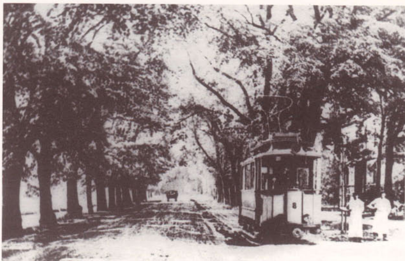
Wagen Nummer 8 in der Belvederer Allee.

te. Deshalb stellen die Droschkenkutscher ihren Fahrgästen die Rätselfrage, warum die Leute hier den Eierkuchen immer nur auf der einen Seite braten. Antwort: weil nur auf der einen Seite