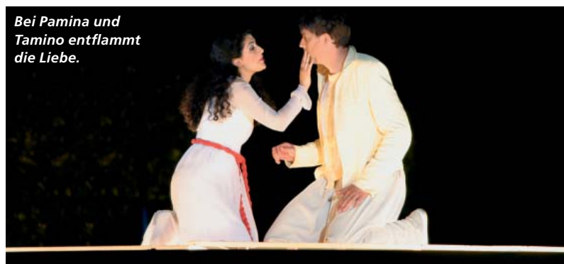
Bei Pamina und Tamino entflammt die Liebe.

Zum Beispiel in der Umgebung von Sondershausen: In herrlicher, idyllischer Lage befindet sich auf einem Plateau der Hainleite der Possen, beliebtes und bekanntes Ausflugs- und Wanderziel. Von dem über 100 Jahre alten Aussichtsturm, dem höchsten Fachwerkturm Deutschlands, kann man bei guter Sicht bis zum Brocken sehen. Im Freizeit- und Erholungspark „Zum Possen“ bieten Tiergehege mit Dam-, Rot- und Schwarzwild, der Bärenzwinger mit dem beliebten Possibär, Vogelvolieren, Bungalowdorf und Kinderspielplatz Erlebnisse und Abwechslung für die ganze Familie. Das ehemalige Jagdschloss „Zum Possen“ (heute Gaststätte) diente einst der fürstlichen Familie von Schwarzburg-Sondershausen als Sommersitz.