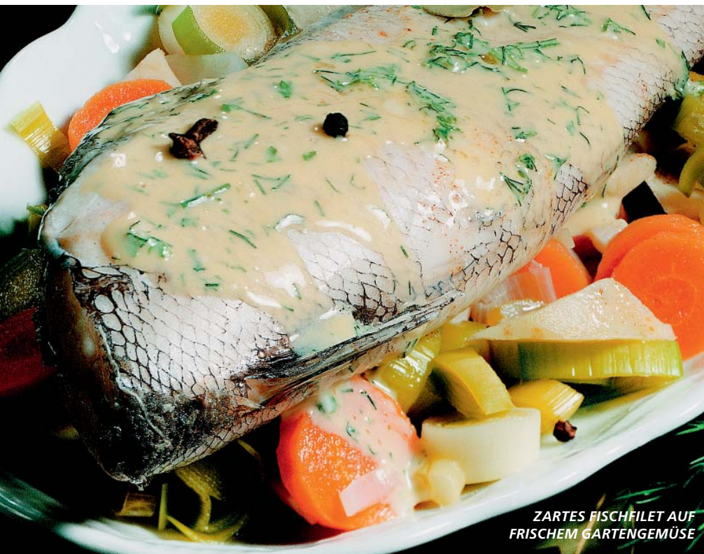
ZARTES FISCHFILET AUF FRISCHEM GARTENGEMÜSE

Stadtwerke Weimar Stadtversorgungs-GmbH Industriestraße 14 99427 Weimar