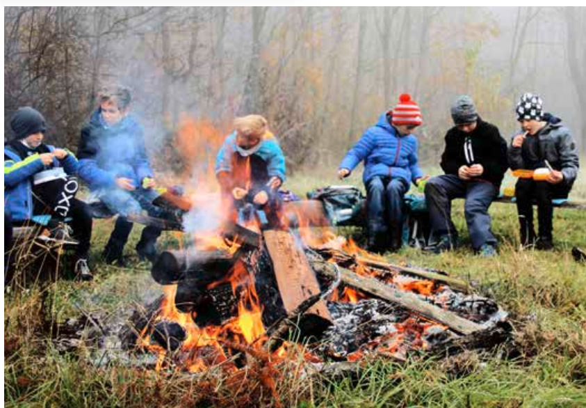
Pause mal anders: Am Lagerfeuer gab es für die Schülerinnen und Schüler eine kleine Stärkung.

Sehen Sie im Video, wie Weimarer Grundschüler beim Aufforsten tatkräftig anpacken.